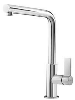
Miscelatore Omega 8497 000