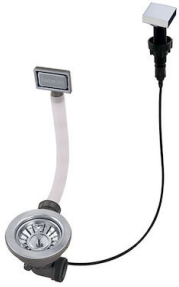
Piletta automatica PM 8407 113