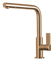
Miscelatore Omega Copper 8497 400