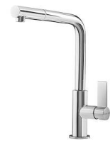
Miscelatore Omega Plus 8497 020