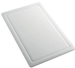
Tagliere in HPDE 8657 001