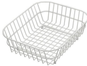
Cestello inox 8612 000